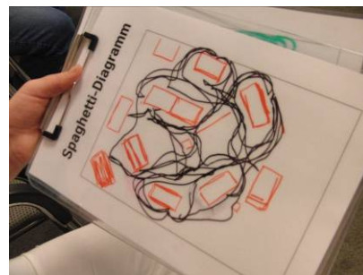
Aufgenommene Transport- bzw. Laufwege der Logistik in Spielrunde 1

Bereiten Sie Ihren Teilnehmern einen unvergesslichen Lean-Tag in der Modellfabrik Power World.